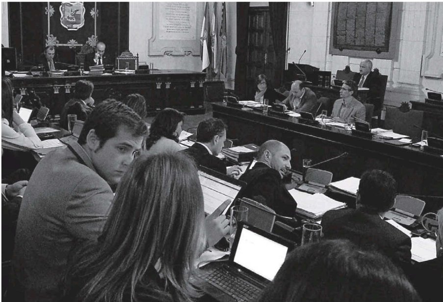
Un momento del pleno ordinario celebrado ayer en el Ayuntamiento de Málaga.

Por lo demás, el regidor tiró de su argumentario más reciente para reiterar que «no tiene sentido partir de cero cuando hay un convenio firmado desde 2003». En este sentido, destacó que tanto el entonces presidente autonómico, Manuel Chaves, como el actual «siempre han estado convencidos de que el trazado soterrado era la mejor solución». El hecho de que se haya producido un cambio político con la entrada de IU como socio de gobierno del PSOE en la Junta «no justifica el cambio de posición», abundó el alcalde. «No se puede tirar todo por la borda ni se puede decir he visto una nueva luz que me dice que lo hablo antes no vale y que lo que vale es esto», afirmó con sorna. Por este motivo, avanzó que en la comisión de seguimiento con la consejera el objetivo es hacerle ver y que reflexione sobre los problemas que conlleva. De hecho, aunque abogó por aprovechar la reunión para analizar los argumentos a favor y en contra de la propuesta, recaló que «tras una primera lectura, y después de una segunda, los técnicos municipales ven problemas de imposible solución en materia de tráfico y transporte público», por lo que concluyó que se «hablará sobre lo nuevo para ver los problemas que crea».