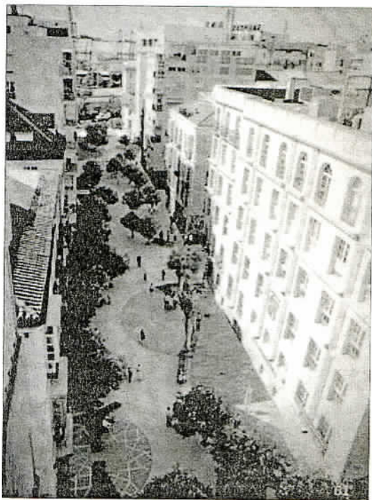
El Soho Málaga. LA OPINIÓN