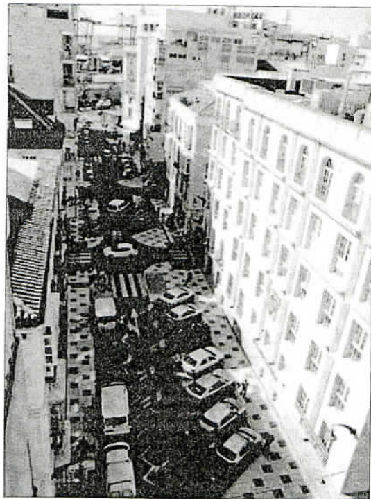
Imagen de la zona.

Esta iniciativa da continuidad a la estrategia de colaboración entre las entidades socias marroquises para el desarrollo del Programa de Cooperación Transfronteriza, produciéndose un continuo intercambio de experiencias y de desarrollo de proyectos de actividades urbanísticas comunes. La dotación económica de este programa establece un reparto por-