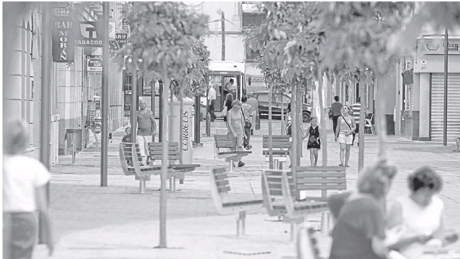
A finales del mes pasado concluyó la obra de peatonalización de la calle Tomás Heredia, primera fase del Soho. :: ÁLVARO CABRERA