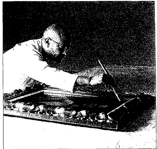
La limpieza de las obras, una tarea delicada. LA OPINIÓN