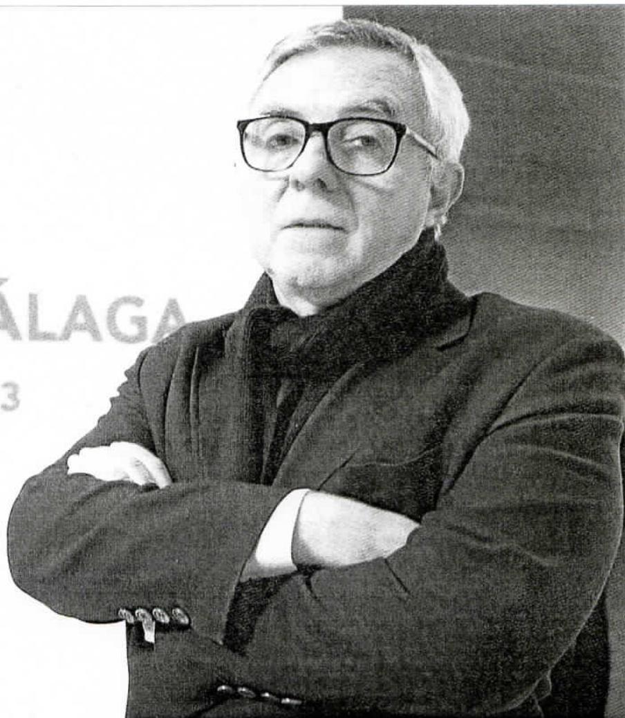
MUSEO DE MÁLAGA y lo será en los próximos tres años. ARCINIEGA

todavía está pendiente. Lo que sí me gustaría decir es que en todo momento me he sentido muy bien tratado por la ciudad. Me he sentido muy bien acogido desde el principio, aunque hemos vivido momentos complicados.