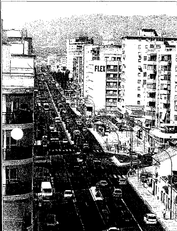
Detalle del tráfico en la avenida de Velázquez. ARCINIEGA

Trayectos. El Centro, la Prolongación de la Alameda con su zona comercial, Teatinos y la zona del Guadalhorce, donde se concentra la mayoría de los polígonos, captan más de la mitad de los tránsitos de vehículos en la ciudad