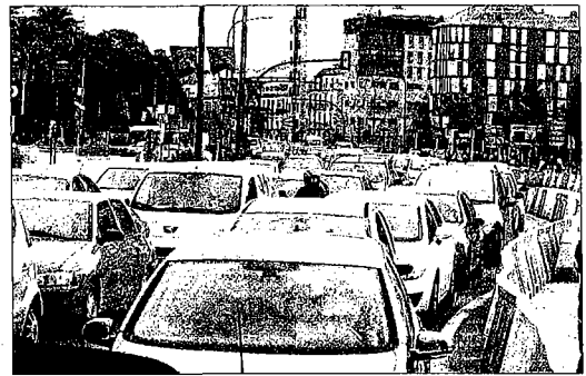
Vehículos a su llegada al centro. LA OPINIÓN

El segundo polo de atracción de viajes es la Prolongación de la Alameda, que corresponde a la avenida de Andalucía y su entorno, a donde se dirige el 12,4% de los vehículos. Estar en el área