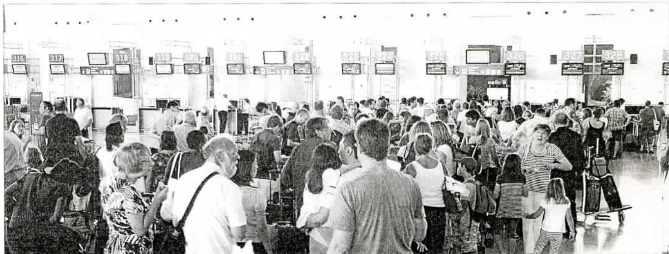
Viajeros esperan su turno en los mostradores de facturación del aeropuerto de Málaga.