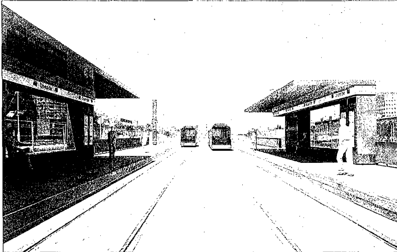
El metro vuelve a provocar diferencias entre las administraciones.