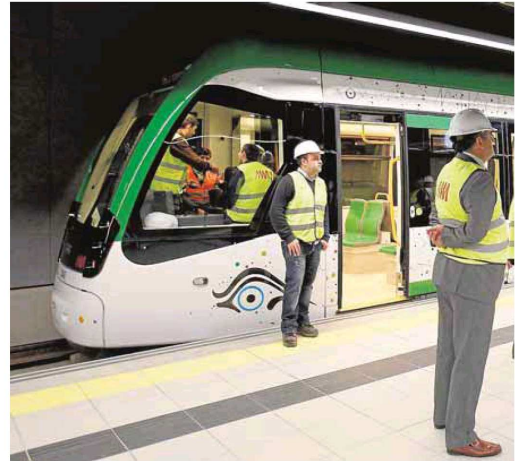
Esta será la primera vez que cualquier ciudadano que lo desee podrá

Duración: Se hará una visita guiada en grupo de 20 minutos.