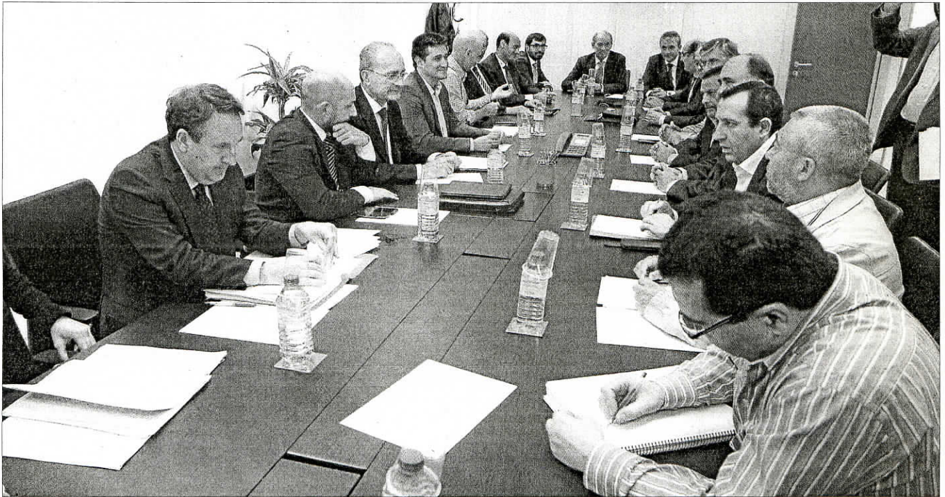
Los representantes municipales, de la Consejería de Fomento y de Metro Málaga se reunieron ayer durante tres horas para intentar desatascar el metro. GREGORIO TORRES