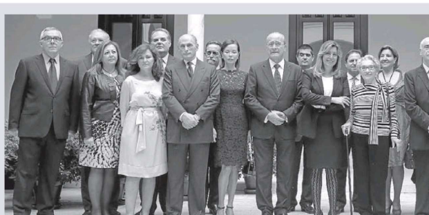
Representantes institucionales y responsables del Museo Picasso Málaga posan en el interior