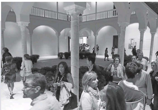
La animación en el museo se prolongó hasta bien entrada la noche.