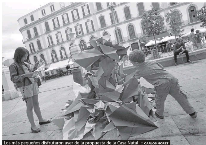
Los más pequeños disfrutaron ayer de la propuesta de la Casa Natal.