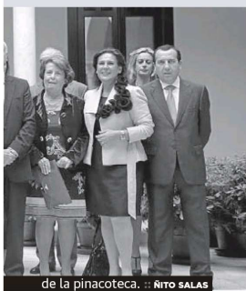
de la pinacoteca.

Las entradas para los conciertos de Mayte Martín y Jorge Pardo se agotaron el martes, la música electrónica sonaba en el patio y más de uno iba entrando con cara de tararear aquello de 'Y nos dieron las diez y las once, las doce y la una y las dos y las tres...'. Y a las tres fueron las dos. 25 horas al día con Picasso.