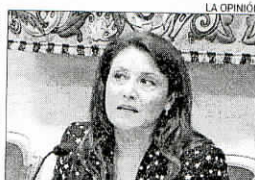
CARMEN CRESPO Delegada Gobierno en Andalucía

► Báñez afirmó que el Gobierno no está satisfecho con la bajada del paro y afirmó que trabajan «intensamente» en las reformas «porque hay muchos españoles» sin empleo.