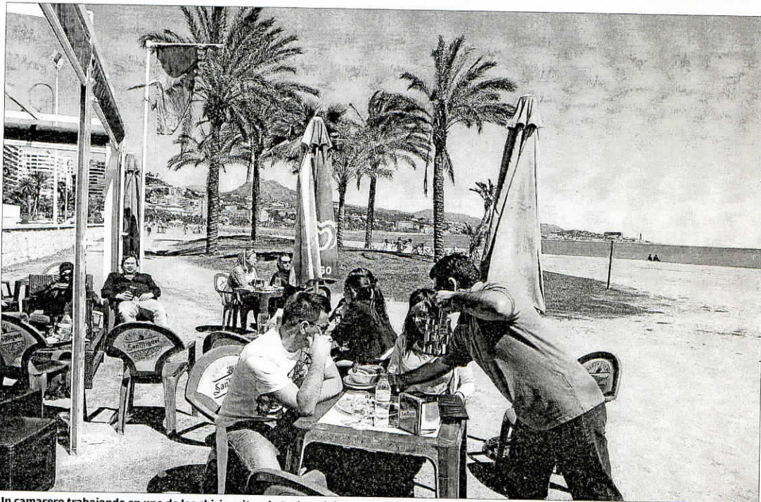
Un camarero trabajando en uno de los chiringuitos de Pedregalejo.

La Asociación de Trabajadores Autónomos (ATA) en Andalucía valoró ayer el incremento de 1.638 autónomos registrada durante el pasado mes de julio en la comunidad autónoma, de los cuales 667 fueron en Málaga, la provincia con mayor incremento del autoempleo. El vicepresidente de ATA en Andalucía, Rafael Amor, defendió que se apoye al autónomo.