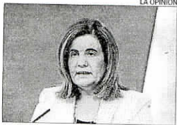
FÁTIMA BÁÑEZ Ministra de Empleo

► Báñez afirmó que el Gobierno no está satisfecho con la bajada del paro y afirmó que trabajan «intensamente» en las reformas «porque hay muchos españoles» sin empleo.