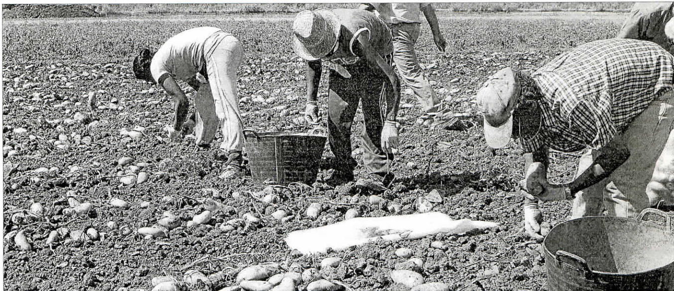
Los trabajadores del sector agrícola son los que declaran los ingresos más bajos, debido a la alta temporalidad de los empleos.