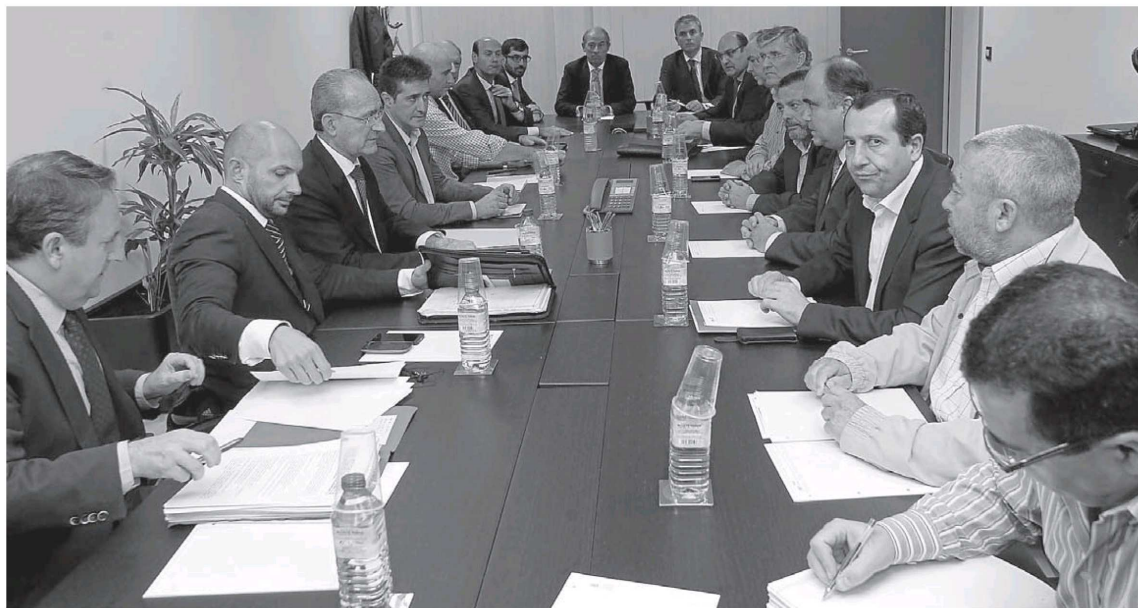
El encuentro se prolongó ayer durante más de tres horas, y aún habrá una nueva reunión sobre el mismo tema el próximo lunes.