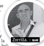
Zorrilla. :: SUR