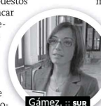
Gámez. :: SUR

Por otro lado y antes de conocerse los presupuestos municipales, María Gámez arremetió ayer contra la política económica del equipo de gobierno del PP. Gámez afirmó que la ciudad se encuentra en «una situación de emergencia» por la elevada deuda que arrastra el Consistorio y el retroceso de las inversiones y el gasto social. Así, explicó que la inversión por habitante cayó un 56% en los últimos cinco años al pasar de 145 a 63 euros. Por el contrario, la deuda municipal siguió aumentando en un 20% hasta alcanzar un ratio de 1.318 euros por habitante, el doble que lo que corresponde a los residentes en Sevilla, según apuntó la dirigente socialista.