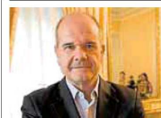
Manuel Chaves (presidente de la Junta 1990-2009)

«El espectacular cambio de Málaga ha sido posible gracias al tirón, al esfuerzo y al trabajo de los malagueños. Ahora miro a mi tierra y veo que obras son amores. Animo a los malagueños a seguir alimentando su ambición de progreso, como gran motor de modernidad y avance».