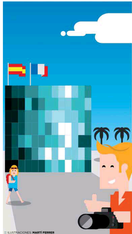
ILUSTRACIONES: MARTI FERRER