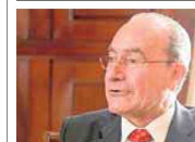
Francisco de la Torre (alcalde de Málaga 2000-Actualidad)

«La transformación de Málaga ha sido radical y profundamente positiva. Hemos pasado de ser una ciudad costera sin más a una referencia en el turismo internacional y en el motor económico de Andalucía y uno de los motores económicos españoles».