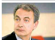
J. L. Rodríguez Zapatero (presidente del Gobierno 2004-2011)

«Apostamos muy fuerte, hicimos el esfuerzo inversor que Málaga merece y merece. Hoy Málaga está en mejores condiciones para afrontar el futuro, en mejores condiciones para generar prosperidad para los malagueños y los españoles».