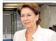
Magdalena Álvarez (ministra de Fomento 2004-2009)

«Apostamos muy fuerte, hicimos el esfuerzo inversor que Málaga merece y merece. Hoy Málaga está en mejores condiciones para afrontar el futuro, en mejores condiciones para generar prosperidad para los malagueños y los españoles».