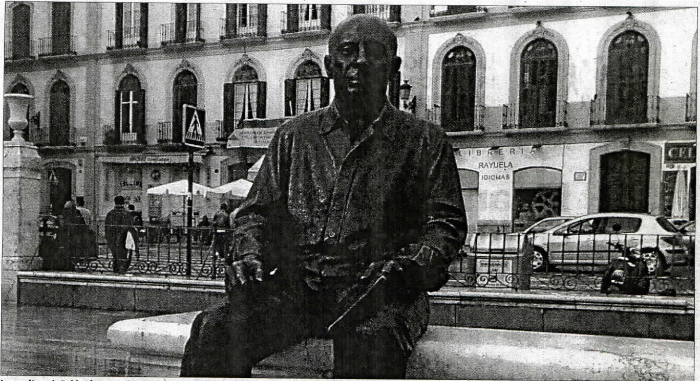
La escultura de Pablo Picasso en la plaza de la Merced.