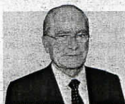
Francisco de la Torre

En coherencia con nuestras líneas estratégicas, Málaga ciudad tecnológica y cultural, polo de innovación y conocimiento y destino turístico de primer orden, estamos desarrollando políticas encaminadas a estimular los sectores productivos locales