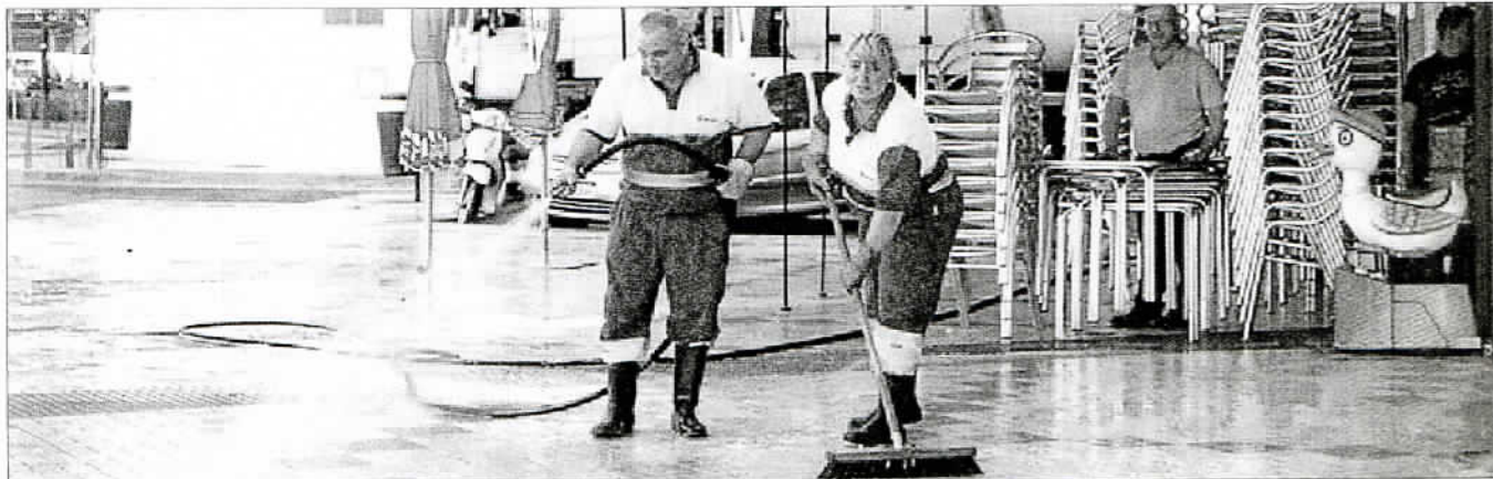
La falta de baldeo de las calles es una de las quejas más frecuentes de los malagueños.