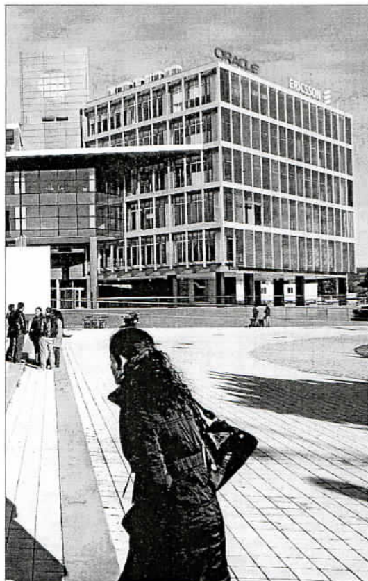
El PTA, un semillero de empresas y actividad emprendedora. ARCAÑUEGA

«Al parque lo siguen sosteniendo las pymes pero la situación es la que es. A unas empresas les va mejor que a otras y en esta primera parte de año ya hemos tenido varios ERE. Esperemos que podamos firmar un buen año aunque es muy posible que los casos de Iso-