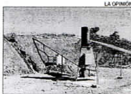
DES GASIFICACIÓN Nuevos pozos