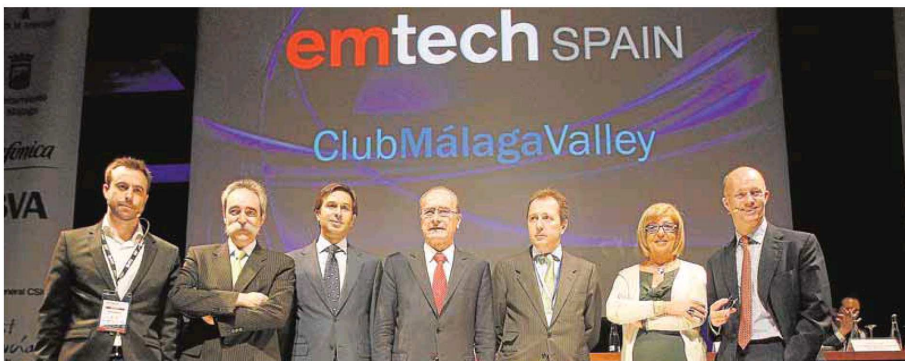
El Club Valley y la conferencia EmTech vuelven a ir de la mano por segundo año consecutivo. :: sur