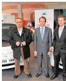
Entrega de los coches. :: sur

por 160 automóviles del modelo Mitsubishi i-miev. Posteriormente, se prevé que se sumen otros 40 Nissan Leaf. A la vez, se están instalando nueve 'electrolíneas' de recarga rápida con capacidad para 23 coches. Los organizadores informaron ayer de que todavía hay algunos vehículos disponibles para los interesados.