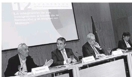
Presentación del estudio sobre la inmigración en Málaga.

el que se produjo en los años anteriores a la crisis. Los problemas económicos han provocado un descenso en el número de inmigrantes que llegan a Málaga en busca de trabajo. El cuaderno, que ha contado con la colaboración del Ayuntamiento de Málaga, la Subdelegación del Gobierno y los sindicatos CC OO y UGT destaca también que una cuarta parte de la población desempleada de Málaga son inmigrantes.