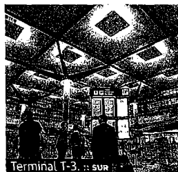
Terminal T-3. :: SUR

► Aeropuerto de Málaga: 8,7 millones para la central eléctrica Sur; 1,1 millones para la integración paisajística y medioambiental del entorno de la segunda pista y la terminal T-3; 15,4 millones para rematar el Acceso Sur; 1,6 millones para la nueva estación de Cercanías. En total, el aeródromo malagueño contará con 44,6 millones, destinados al remate del llamado Plan Málaga.