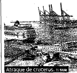
Atraca de cruceros.

► Agua: Las infraestructuras hidráulicas obtendrán 9,7 millones, especialmente para la reutilización de aguas residuales mediante tratamiento terciario, de manera que se puedan usar para el riego (cinco millones). Y otros 4,5 millones para avanzar en la construcción de la tubería que mejorará el transporte del agua desde el azud de Aljaima (Cártama) hasta la desalobradoradora de El Atabal, en Málaga.