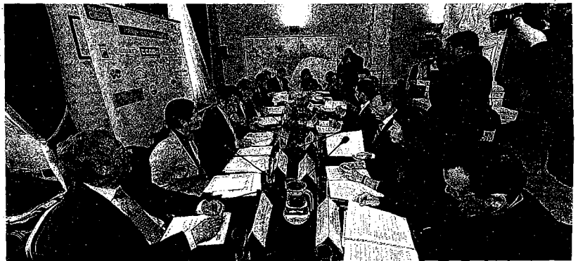
Momento de la constitución del jurado, presidido por Francisco de la Torre.