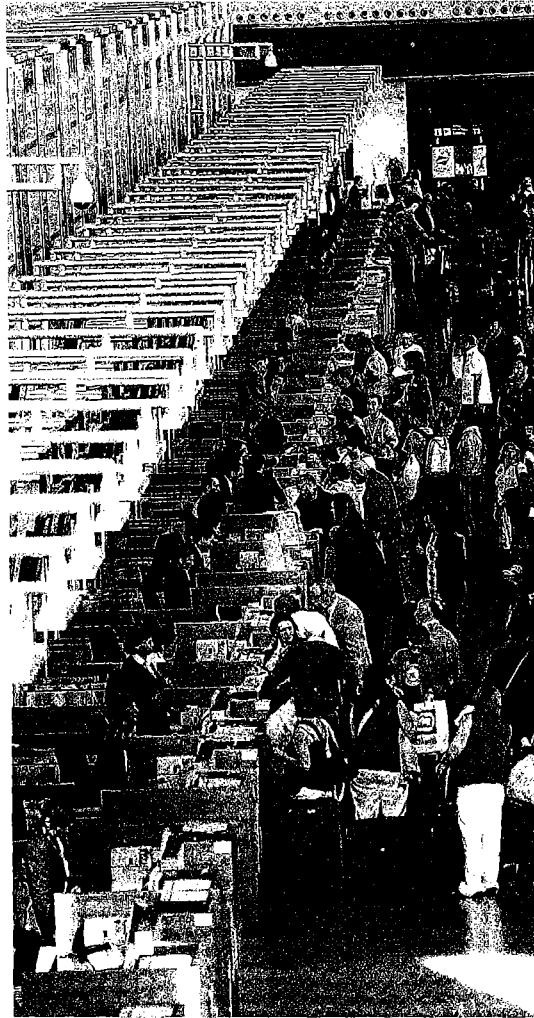
Colas de ayer en los mostradores de facturación.

La normalidad reina en esta primera fase de estas vacaciones y se extiende a la actividad de la estación de ferrocarril, donde los trenes llegan y salen con refuerzos especiales. Cabe reseñar también la implantación del horario nocturno en el Cercanías de Málaga, que cuenta este año con seis trenes especiales en la conexión con Álora.