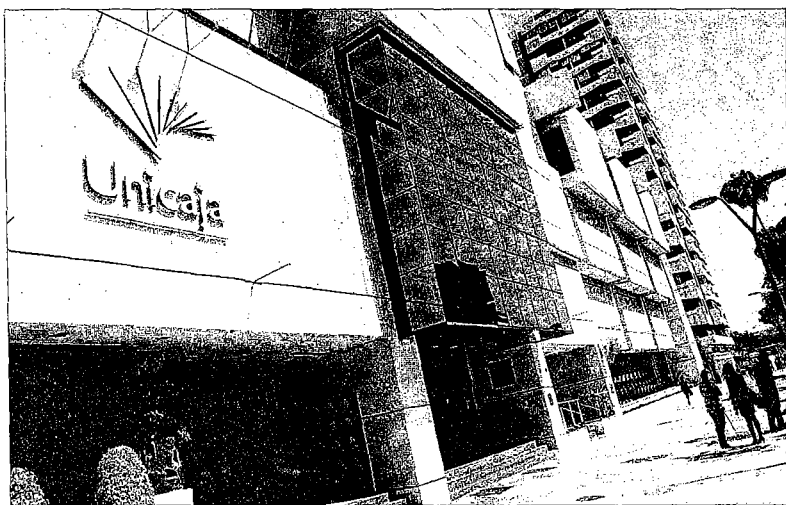
La sede central de Unicaja en la avenida de Andalucía.