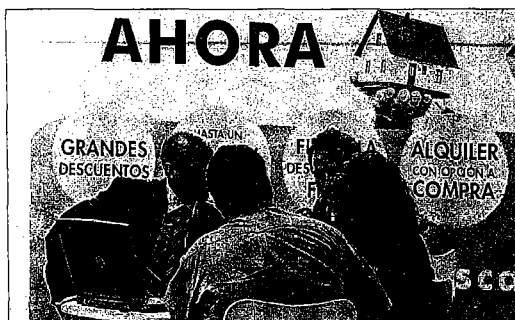
Clientes negocian la compra de una vivienda. CARLOS CRIADO

«Como herramienta principal de venta hacen hincapié en la facilidad de acceso a la financiación, eso sí, exclusivamente en la compra de sus inmuebles. Este último aspecto, junto con una reducción significativa en el precio, es lo que realmente dinamiza las ventas», comenta la delegada de Aguirre New-