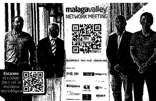
Málaga Valley celebra un encuentro interactivo para empresarios. :: SUR

recto el evento y se podrán concertar citas con los asistentes a través de esta aplicación móvil. En otro de los espacios, llamado 'Formación y promoción', Ideanto, organizadora del evento, impartirá un microtaller temático y los seis patrocinadores podrán presentar sus empresas y servicios. También habrá una zona de cooperación para la interacción entre empresas, trabajadores 'freelance' y otras entidades. Una de las zonas más innovadora tiene el nombre de 'Conectamos jugando' y en ella los asistentes podrán jugar en equipo a la consola, bajo la idea de que jugando también se pueden establecer vínculos y hacer negocio.