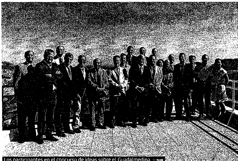
Los participantes en el concurso de ideas sobre el Guadalmedina.