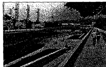
Infografía del río en el proyecto de Seguí. / N. ALCALÁ

el de Granada. «Es un proyecto pensado para este momento de escasez y de cambio de ciclo, que obliga a los arquitectos a hacer proyectos