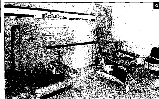
► LAS PLAZAS HOSPITALARIAS cerradas se encuentran en las plantas tercera y quinta del pabellón B. 1 Imagen de la entrada al área clausurada. 2 Pasillo de la antigua Unidad de Medicina Interna III, cerrada y vacía. 3 Imagen del interior del control cerrado, donde se ven cajas apiladas y hay unas 36 camas sin usar. 4 Una de las habitaciones, con uso de Hospital de Día. LA OPINIÓN