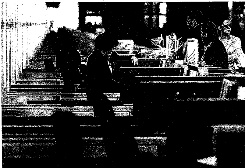
Mostradores de facturación del aeropuerto de Málaga-Costa del Sol. :: SUR

Todo ello en vísperas del estreno de una segunda pista para la que el sector turístico reivindica que desempeñe el papel de despegue definitivo de esta terminal en nuevos mercados y el trampolín con la que convertir esta infraestructura en el punto de enlace de los vuelos procedentes del continente americano con destino al asiático. Mientras tanto, confían en que esta racha de resultados negativos dure lo que tardará en llegar la Semana Santa, con la que el destino dará por inaugurada la temporada alta. En los dos primeros meses del año han pasado por la terminal malagueña 1,1 millón de pasajeros, un 6,5% menos.