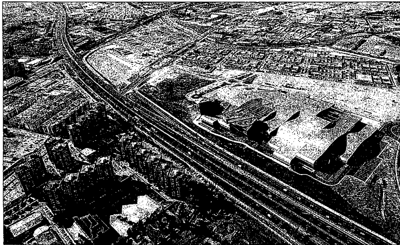
Vista aérea del Palacio de Ferias, que acogerá el foro el 8 y 9 de febrero el foro Transfiere.

El responsable del foro señaló que en una época de dificultades económicas como la actual es necesario «optimizar los recursos» y, en este sentido, Transfiere pretende contribuir a «focalizar de la