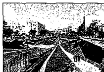
Imagen del proyecto ganador. F.S.

El proyecto, del arquitecto afincado en Málaga José Seguí -autor de la remodelación de La Rosaleda-, prevé eliminar los muros para integrar el río, dejar una lámina de agua permanente y completar los cinco kilómetros de cauce con diferentes equipamientos: un embarcadero en su tramo fi-