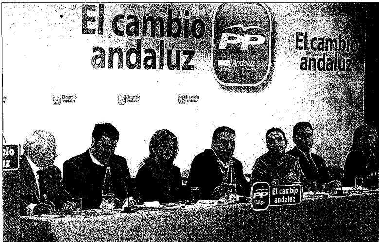
Imagen de la mesa central de la conferencia organizada por el PP. CARLOS CRIADO