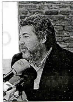
Líder nacional de Equo.

Equo Málaga recogerá hoy, a partir de las 11.00 horas, firmas para solicitar un referéndum sobre el rescate a la banca. La formación considera que las movilizaciones ciudadanas que están teniendo lugar «expresan de forma rotunda el creciente descontento de la ciudadanía» ante la situación económica y cómo se está gestionando la crisis. Así, consideraron necesario el referéndum porque «una decisión de esta envergadura tienen que ser tomada por la ciudadanía». B.A. MÁLAGA