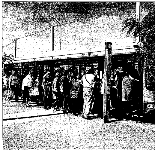
Usuarios del autobús en el Cortijo de Torres.

Otro problema que se encuentran los ciudadanos a la hora de usar transporte público es el tiempo que se tarda, ya que, según el estudio, Málaga es la zona en la que más minutos se emplean para ir al trabajo (25,8 minutos), a estudiar (27,7) o para ir a visitar a los familiares (26,4). En cuanto a la modalidad elegida el 65% opta por el bus urbano,