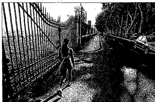
Perspectiva del Paseo de los Curas. GREGORIO TORRES

Es el caso del concurso para la contratación de la tercera fase de las obras del skate park (pista de patinaje) prevista entre en Arroyo El Cuarto, entre el Parque del Norte y la fábrica de ladrillos Salyt, en Bailén Miraflores. Al concurso, que tiene un presupuesto de 676.000 euros y un plazo de ejecución de seis meses, se han presentado, según informó un portavoz de la Gerencia de Urbanis-