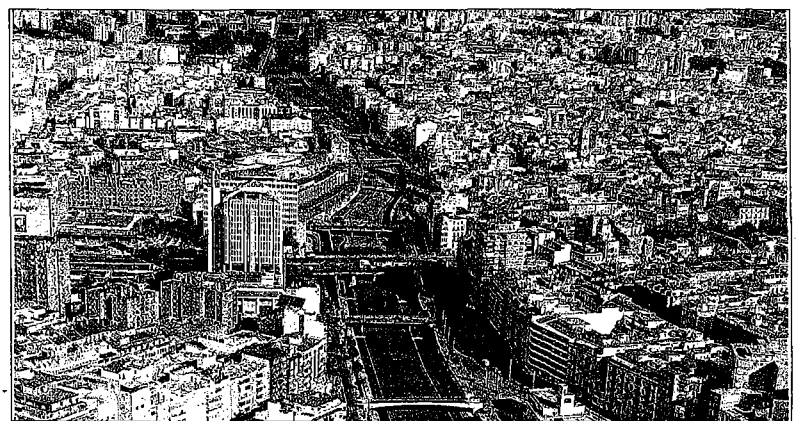
El objetivo es que el cauce del río forme parte de la vida de la ciudad. GREGORIO TORRES

Una vez entregados estos galardones inaugurarán una muestra en la que podrán contemplarse las propuestas de los dieciséis equipos participantes plasmadas