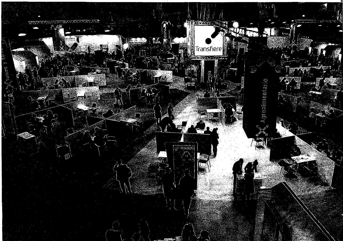
El espacio central de Transfiere en un gran círculo dividido en seis sectores económicos con mesas de trabajo para encuentros profesionales entre empresas, grupos de investigación y