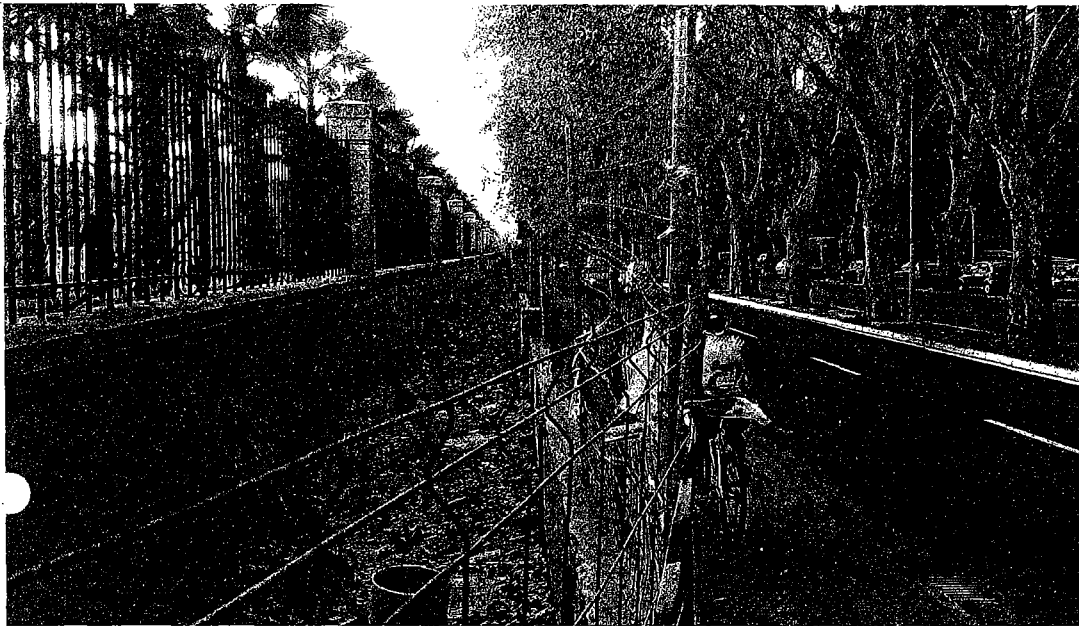
Basuras y hojas secas siguen acumulándose entre la antigua verja mantenida en el borde del Palmeral y la valla de obra.