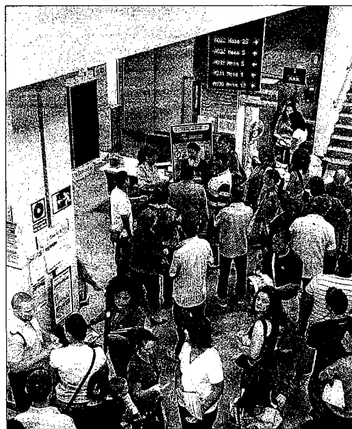
Vista de una de las oficinas del SAE en Málaga.

En el caso concreto de Málaga, el responsable de la patronal alude al efecto positivo del calendario,