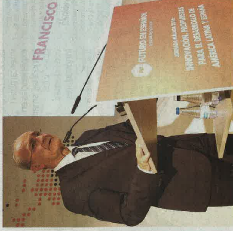
El alcalde de Málaga, Francisco de la Torre.