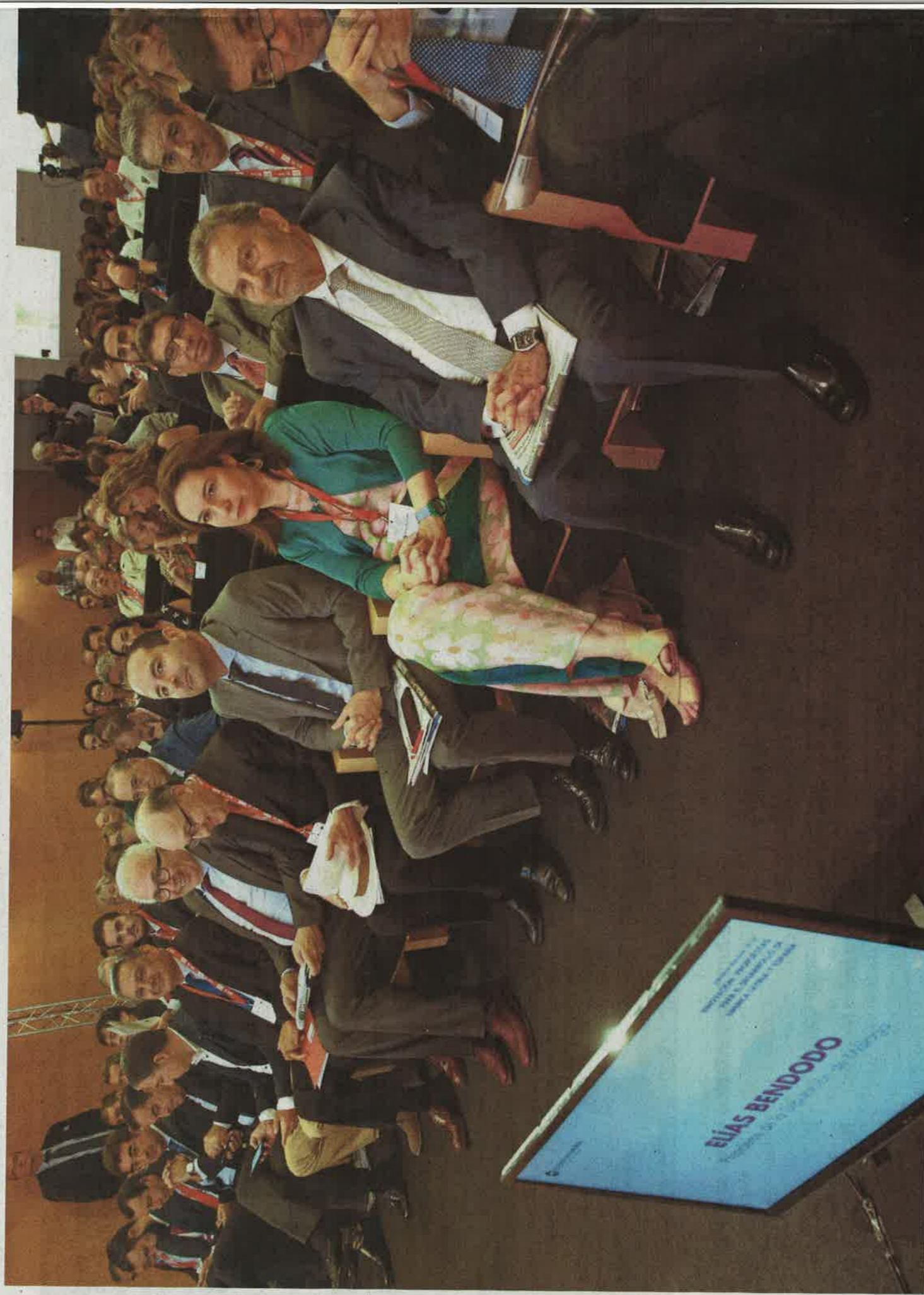
Unas trescientas personas, entre las que había numerosas personalidades del ámbito político y empresarial, asistieron al foro Futuro en Español en Málaga.