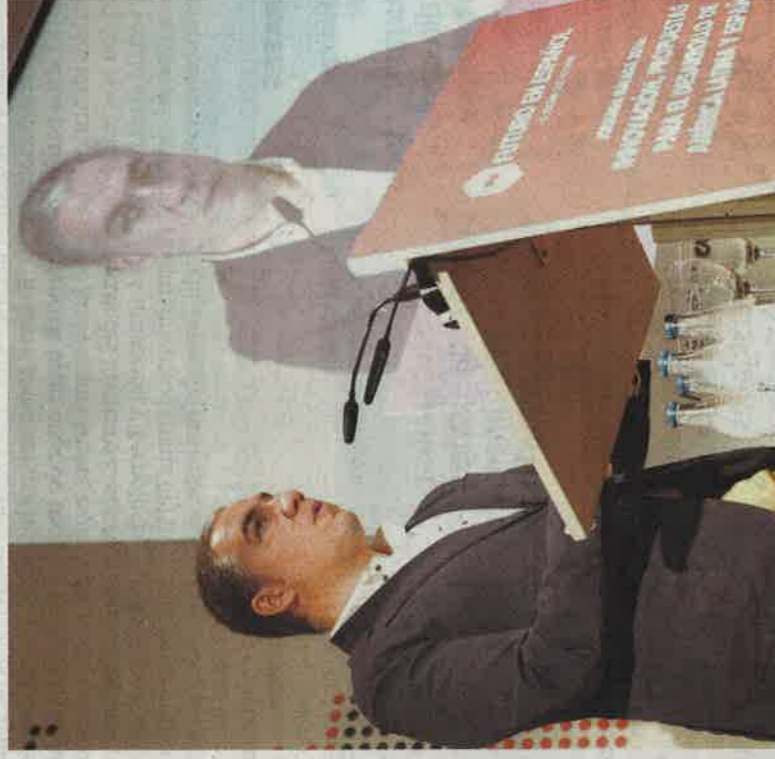
El presidente de la Diputación de Málaga, Elías Bendodo.