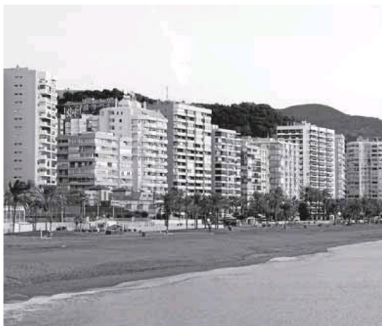
Se deben favorecer los espacios peatonales en el paseo.

Al concurso podrán presentarse arquitectos y estudiantes, tanto españoles como extranjeros, que deberán presentar un anteproyecto para transformar el paseo, al que la Escuela de Arquitectura considera como «un espacio de oportunidad para la creación de un espacio público a través de la reubicación de aparcamientos en superficie». «Con el nuevo espacio pú-