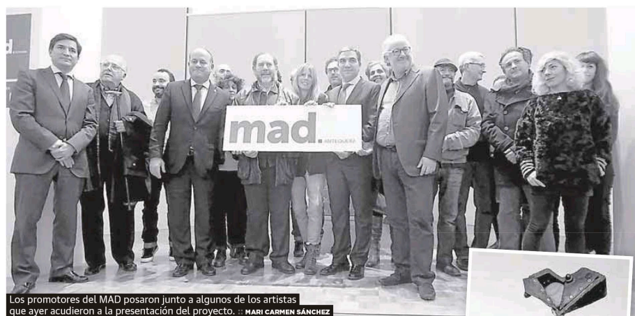
Los promotores del MAD posaron junto a algunos de los artistas que ayer acudieron a la presentación del proyecto.

El Museo de Arte de la Diputación (MAD) presenta sus primeras propuestas