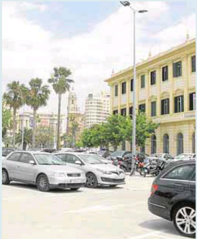
▲ Idea de Urbanismo. La Gerencia desechó la propuesta y planteó ubicarla en el aparcamiento de la Autoridad Portuaria. :: M. C. S.