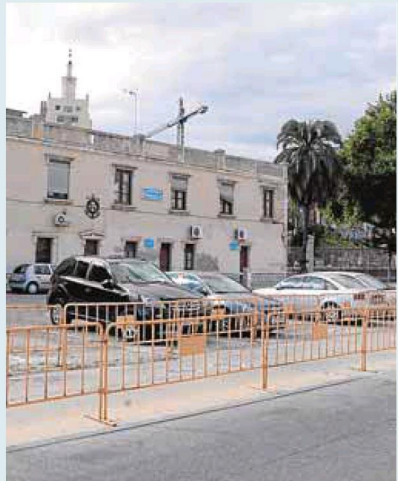
▲ Contraoferta del Puerto. Plata ha planteado, por último, una zona a la espalda de la estación de autobuses.