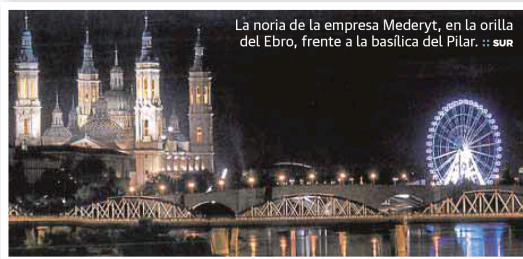
La noria de la empresa Mederyt, en la orilla del Ebro, frente a la basílica del Pilar.

L a iniciativa de una noria en el Puerto de Málaga, pendiente sólo del permiso del Ayuntamiento de Málaga tras el visto bueno del Puerto, es una de esas ideas que generan debate y expectación en las ciudades. La imagen que hoy ilustra la portada de SUR permite ver con claridad cómo quedaría esta atracción y el impacto que tendría. El hecho de que su instalación sea temporal (entre seis y ocho meses) y la buena aceptación que ha tenido en otras ciudades como Zaragoza son argumentos a favor para apoyar esta propuesta que se convertiría en un atractivo más tanto para turistas como para residentes. El asunto del impacto visual generará posiciones encontradas entre los que lo consideraran excesivo y los que minimizarán el efecto en relación a su entorno y miran los ejemplos de ciudades de todo el mundo con norias instaladas en entornos monumentales. Sea cual sea el futuro de este proyecto, parece una idea atractiva y positiva para la ciudad, sobre todo teniendo en cuenta que si no goza de la aceptación ciudadana se retirará en unos meses. El Ayuntamiento de Málaga será el que diga la última palabra y no debiera caer en el error de querer contentar a todo el mundo.