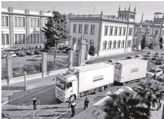
El camión llegó a Tabacalera minutos después de las cinco de la tarde. :: NITO SALAS