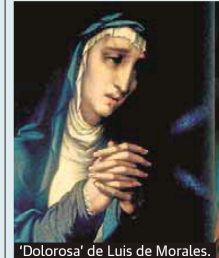
'Dolorosa' de Luis de Morales.