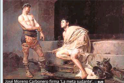
José Moreno Carbonero firma 'La meta sudante'.