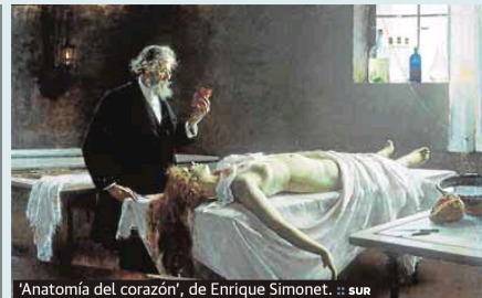
'Anatomía del corazón', de Enrique Simonet.

tres años para que la Aduana se convirtiera en la primera subse de la pinacoteca madrileña. El planteamiento lanzado por el entonces candidato del PP a la Junta de Andalucía, Javier Arenas, encontró el respaldo del presidente del Gobierno, Mariano Rajoy; pero el asunto ni siquiera llegó a debatirse en el Patronato del Museo del Prado, máximo órgano decisorio de la institución.