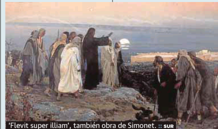
'Flevit super illiam', también obra de Simonet. :: sur